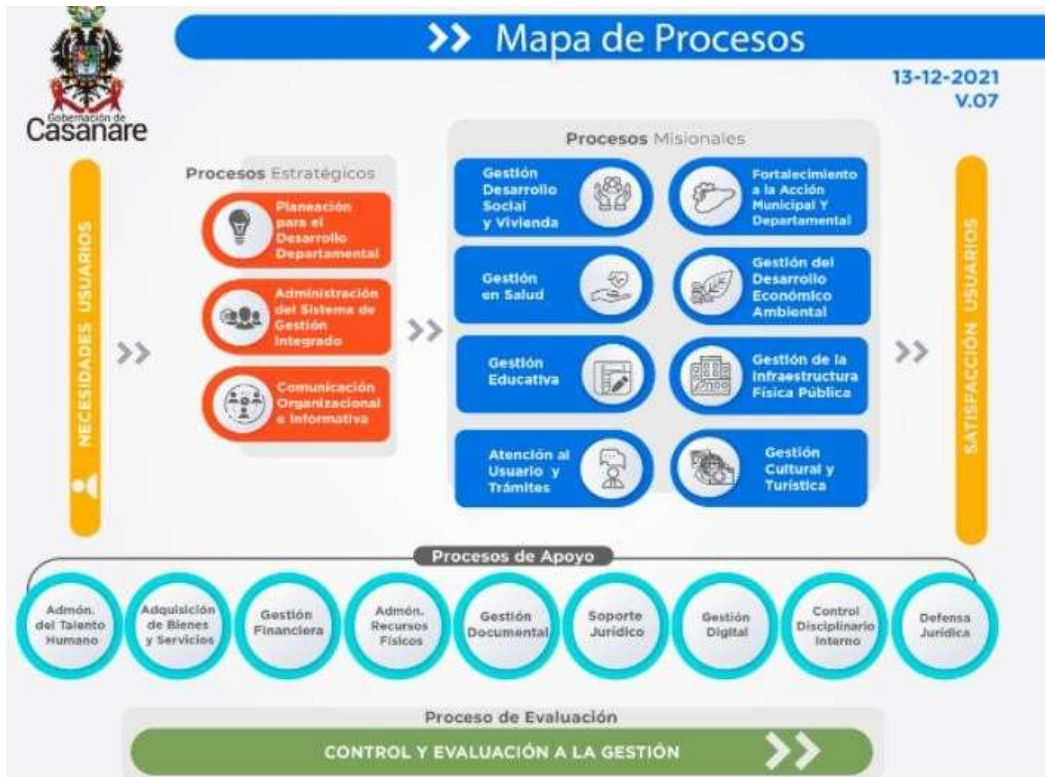
Ilustración 3 Mapa de Procesos Gobernación