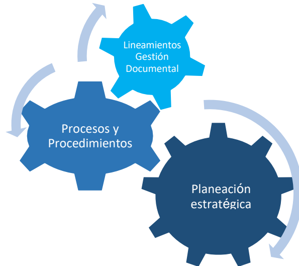
Ilustración 1. Alcance Gestión Documental.