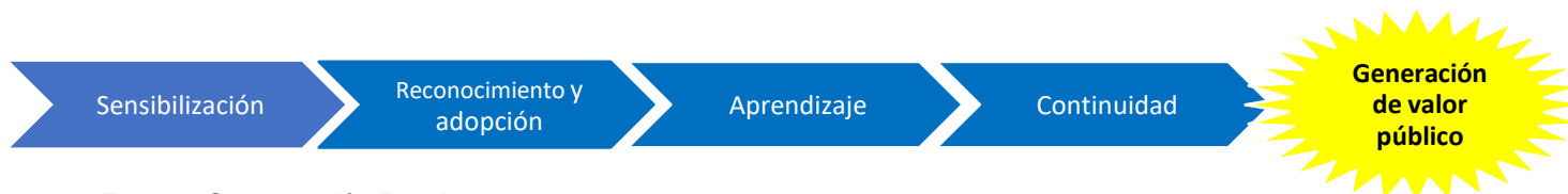
Ilustración 6 Apropiación

Finalmente, se busca establecer y gestionar el repositorio digital de conocimiento, en el cual se incorporen las buenas prácticas realizadas, experiencias, material de capacitación y campañas realizadas en materia documental para el fortalecimiento de las competencias y apropiación de los archivos institucionales.