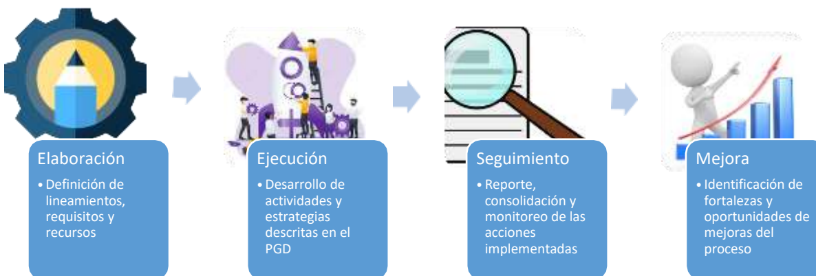
Ilustración 8 Fases de Implementación

De acuerdo con el Decreto 1080 de 2015, la implementación del Programa de Gestión Documental comprende las fases de elaboración, ejecución, seguimiento y mejora, siguiendo con el ciclo PHVA.